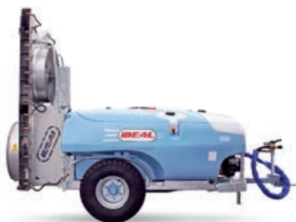
● 2000 FÖHN